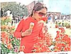
जागरण सिटी रोहतक में रंग-बहार कार्यक्रम के दौरान एक महिला का एक फूलों की खूबसूरत छटा में खड़ा होना।