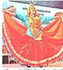
सांस्कृतिक कलाकारों ने हरियाणा दिवस कार्यक्रम में अपने कलात्मक प्रदर्शन से दर्शकों को मंत्रित किया।