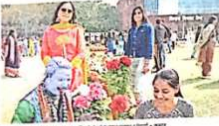
जागरण सिटी रोहतक में रंग-बहार कार्यक्रम के दौरान एक महिला का एक हाथी की मूर्ति के साथ फूलों की खूबसूरत छटा में खड़ा होना।