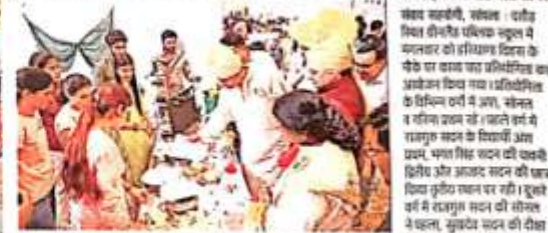
सांस्कृतिक कलाकारों ने हरियाणा दिवस कार्यक्रम में अपने कलात्मक प्रदर्शन से दर्शकों को मंत्रित किया।

हरियाणा के देसी व्यंजनों की महक फैली : हरियाणा के देसी व्यंजनों की महक और सुगंध हरियाणा दिवस के आयोजन में महर्षि दयानंद विश्वविद्यालय में आयोजित हरियाणा फूड फेस्टिवल में खुश फैली। इस दौरान देसी व्यंजनों का प्रदर्शन किया गया।