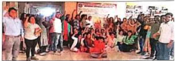
शहीदों के दिवस पर पुष्प अर्पित करते शिक्षक एवं विद्यार्थी व कार्यक्रम में उपस्थित शिक्षक एवं विद्यार्थी।