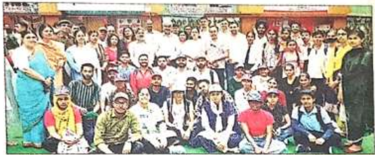
एमडीयू के खेल विभाग में आयोजित शिविर में शामिल रक्तदाता और अतिथि।