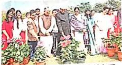
जागरण सिटी रोहतक में रंग-बहार कार्यक्रम के दौरान एक महिला का एक फूलों की खूबसूरत छटा में खड़ा होना।