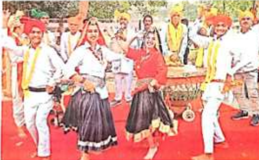
सांस्कृतिक कलाकारों ने हरियाणा दिवस कार्यक्रम में अपने कलात्मक प्रदर्शन से दर्शकों को मंत्रित किया।

हरियाणा दिवस के तहत हरियाणा, पंजाब व हिमाचल प्रदेश के कलाकारों ने रोहतक के महर्षि दयानंद विश्वविद्यालय में अपने कलात्मक प्रदर्शन से दर्शकों को मंत्रित किया। कार्यक्रम में कुलपति ने कलाकारों को बधाई दी।