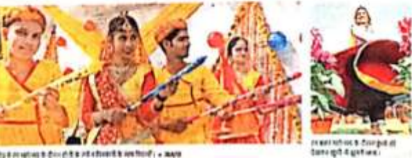
जागरण सिटी रोहतक में रंग-बहार कार्यक्रम के दौरान एक महिला का एक हाथी की मूर्ति के साथ फूलों की खूबसूरत छटा में खड़ा होना।