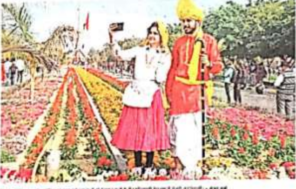
जागरण सिटी रोहतक में रंग-बहार कार्यक्रम के दौरान एक महिला का एक हाथी की मूर्ति के साथ फूलों की खूबसूरत छटा में खड़ा होना।