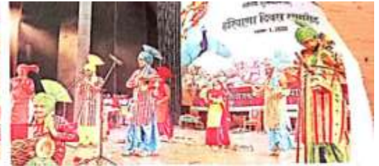
सांस्कृतिक कलाकारों ने हरियाणा दिवस कार्यक्रम में अपने कलात्मक प्रदर्शन से दर्शकों को मंत्रित किया।