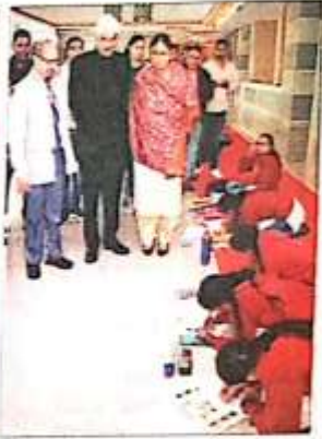
एमडीयू के टैगोर सभागार में पोस्टर मेकिंग एवं स्लोगन लेखन प्रतियोगिता में पोस्टर बनाते विद्यार्थी। अग्र इमाल

हैं, जिसका एक अलग ढंगाने। यस जकरत है कि दिव्यांगजनों को आमजनों की तरह अवसर उपलब्ध करवाने की। समानता का भाव देने हुए सम्मान सम्मान देने की।