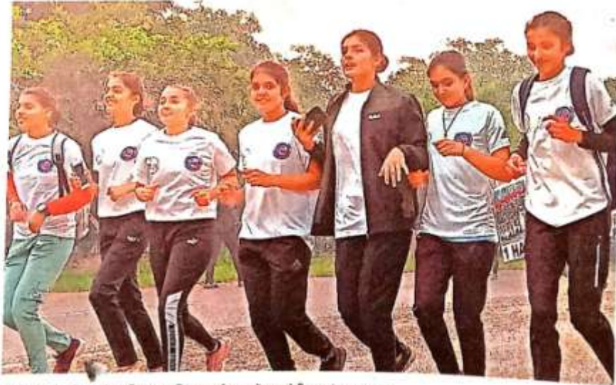
एमडीयू के खेल विभाग में राष्ट्रीय एकता दिवस पर मैराथन में भाग लेती छात्राएं।