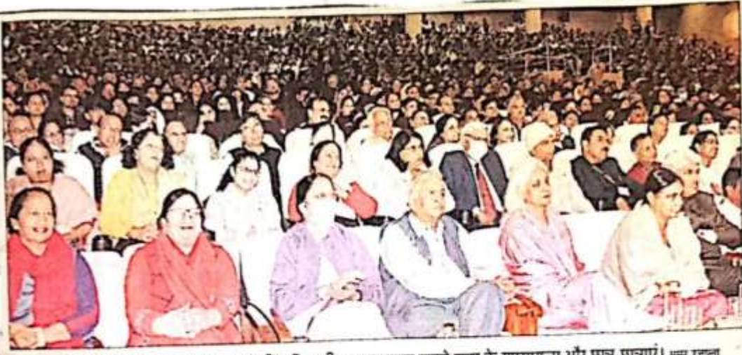
एमडीयू के टैगोर सभागार में रविवार को बीके शिवानी का व्याख्यान सुनते शहर के गण्यमान्य और छात्र-छात्राएं। भ्रम उत्पन्न