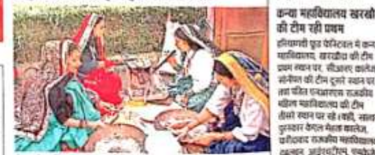
सांस्कृतिक कलाकारों ने हरियाणा दिवस कार्यक्रम में अपने कलात्मक प्रदर्शन से दर्शकों को मंत्रित किया।

हरियाणा के देसी व्यंजनों की महक फैली : हरियाणा के देसी व्यंजनों की महक और सुगंध हरियाणा दिवस के आयोजन में महर्षि दयानंद विश्वविद्यालय में आयोजित हरियाणा फूड फेस्टिवल में खुश फैली। इस दौरान देसी व्यंजनों का प्रदर्शन किया गया।