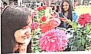
जागरण सिटी रोहतक में रंग-बहार कार्यक्रम के दौरान एक महिला का एक हाथी की मूर्ति के साथ फूलों की खूबसूरत छटा में खड़ा होना।