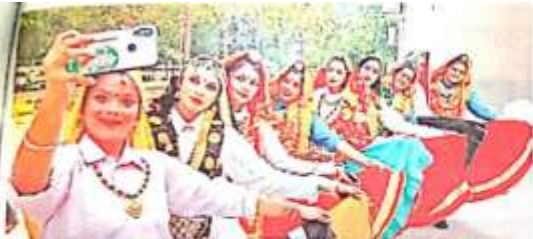
सांस्कृतिक कलाकारों ने हरियाणा दिवस कार्यक्रम में अपने कलात्मक प्रदर्शन से दर्शकों को मंत्रित किया।