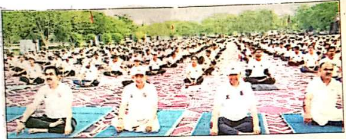
एम.डी.यू. में योग करते शिक्षक।

Thursday, 22 June 2023 www.punjabkesari.com